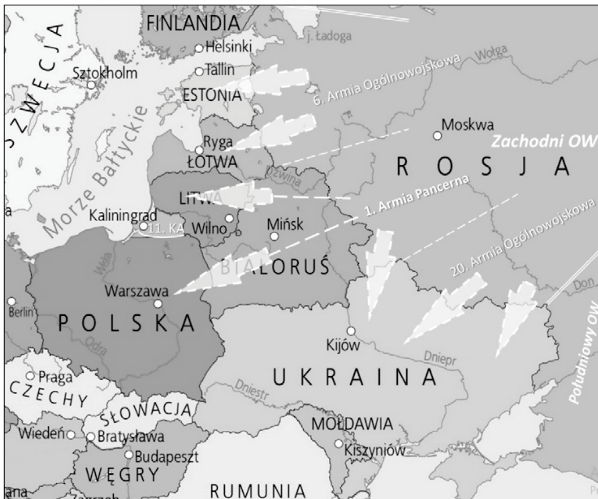
Mapa nr 2. Trzy Armie i 11 Korpus Armijny Zachodniego OW Federacji Rosyjskiej i ich potencjalne przeznaczenie (kierunki działań)

ciwnika, zakładany cel, czas i przestrzeń działań wojennych, a szczególnie rodzaj konfliktu zbrojnego, będą miały decydujący wpływ na rozmieszczenie i użycie Sił Zbrojnych FR 13 .