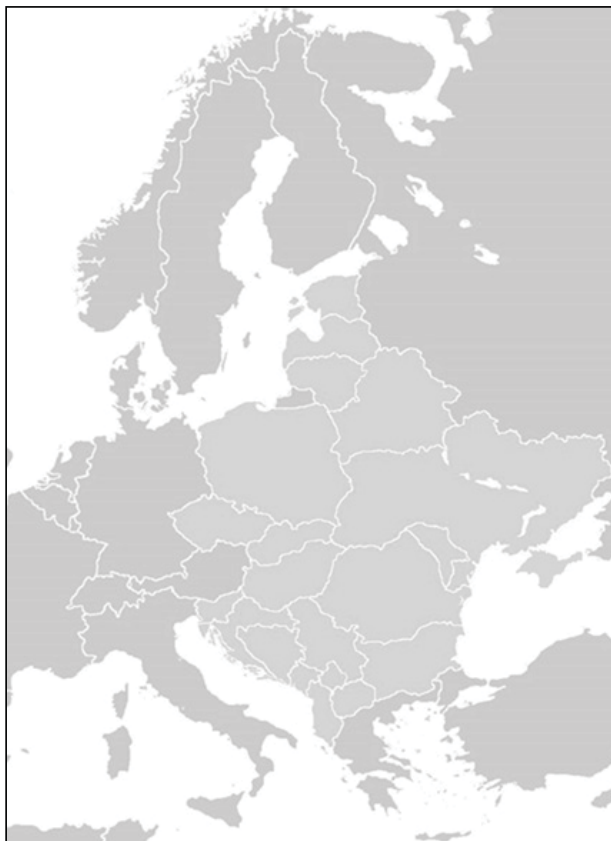
Mapa nr 1. Europa Środkowo-Wschodnia – ujęcie geopolityczne

Zgodnie z oficjalnymi dokumentami Wspólnoty Europejskiej i NATO pod określeniem Europa Środkowo-Wschodnia skupiają się kraje byłego bloku socjalistycznego. Najczęściej wymienia się wówczas w Unii Europejskiej następujące kraje: Polska, Słowacja, Czechy, Węgry, Bułgaria, Rumunia, Litwa, Łotwa, Estonia, Słowenia i Chorwacja. Czasami, w niektórych opracowaniach naukowych lub dokumentach politycznych do krajów Europy Środkowo-Wschodniej dołącza się Ukrainę, Białoruś i Mołdawię (mapa nr 1). Należy zaznaczyć, że po upadku Związku Radzieckiego sytuacja geopolityczna w tym regionie zmieniła się całkowicie a wiele państw nie ma ciągle w pełni ukształtowanej sytuacji społeczno-polityczno-gospodarczej i boryka się z problemami rozwoju demokracji, gospodarki i bezpieczeństwa. Jednak za sprawą przemian, które nastąpiły w ciągu ostatnich 30 lat należy uznać ten obszar za ważny region geostrategiczny 1 .