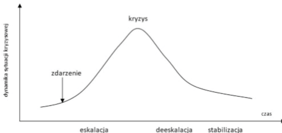
Ryc. 1. Etapy sytuacji kryzysowej

Sytuacje kryzysowe mogą powodować konieczność wprowadzenia tzw. stanów nadzwyczajnych, czyli stanu klęski żywiołowej, stanu wyjątkowego czy stanu wojennego. Ma to na celu stworzenie warunków do zapobiegania lub szybkiego usuwania skutków kryzysu, ale jednocześnie związane jest z koniecznością wprowadzenia pewnych ograniczeń bądź zawieszeniem praw obywatelskich. Wprowadzenie tych stanów umożliwia wzrost potencjału logistycznego oraz czasu jego zaangażowania w działania na rzecz poszkodowanej ludności. Z logistycznego punktu widzenia wprowadzenie stanów nadzwyczajnych pozwala na pozyskiwanie dodatkowych zasobów materiałowych i osobowych oraz skierowanie ich do realizacji zadań logistycznych w czasie określonym lub nieokreślonym, związanych z zabezpieczeniem poszkodowanej ludności, jak też wsparciem sił ratowniczych zgodnie z obowiązującymi przepisami prawa (Pac, 2015).