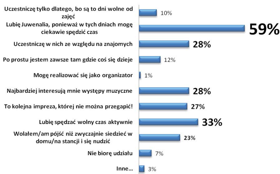
Ryc. 1. Motywy uczestnictwa studentów w Juwenaliach

Przeprowadzone badania pozwoliły ustalić, co motywuje studentów do uczestniczenia w Juwenaliach, a co ich zniechęca. Ustalono również, co ma największy wpływ na organizację programu imprezy, a także zdanie badanych na temat kto powinien za tę imprezę odpowiadać. Stworzono nowe pomysły, które można by było wykorzystać podczas Juwenaliów w przyszłości i sprawdzono, które podobają się najbardziej.