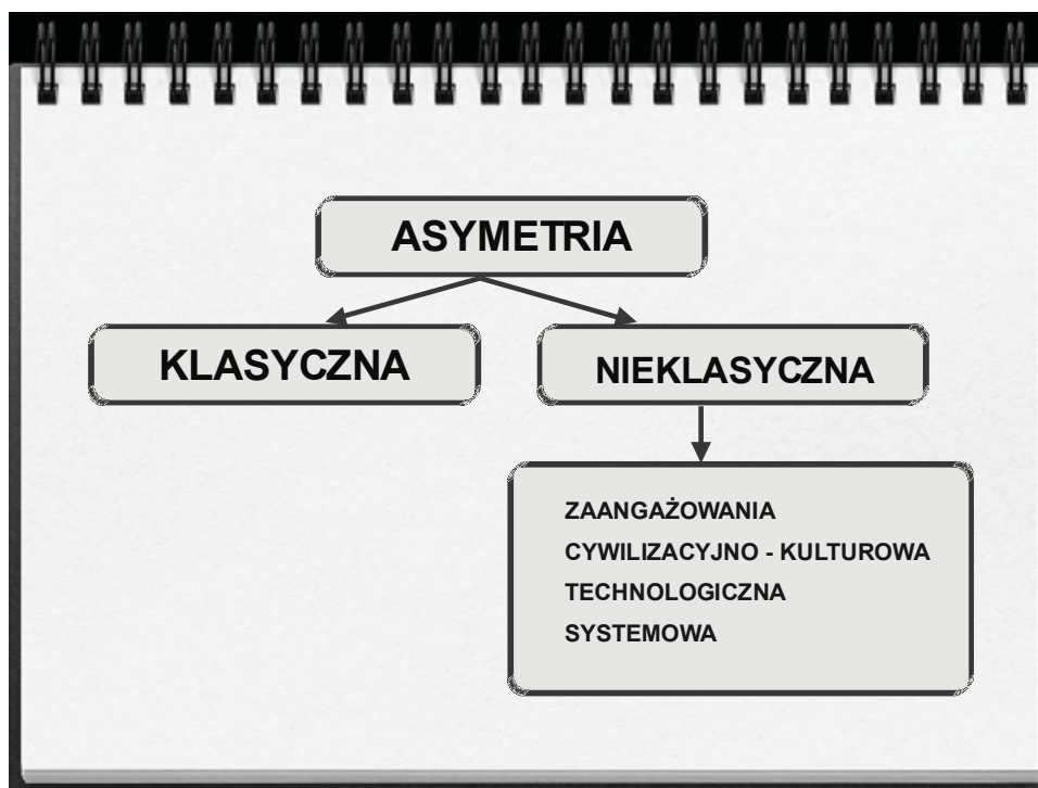
Rys. 2. Formy asymetrii

Podstawą wyróżnienia powyższych form asymetrii była przede wszystkim dysproporcja, odmienność i nieprzystawalność. Dysproporcja jest podstawowym kryterium podziału na asymetrię klasyczną i nieklasyczną. Asymetria klasyczna to przede wszystkim podział pod względem potencjału, zarówno ilościowego, jak i jakościowego. Asymetria nieklasyczna w swojej strukturze dokonuje podziału względem kryterium jakimi są odmienność i nieprzystawalność.