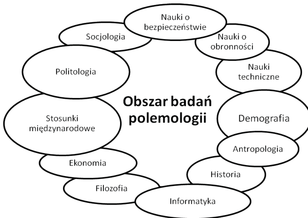
Rys. 1. Korelacja obszarów badań w polemologii.

Najczęściej wskazuje się na: nauki o obronności, nauki o bezpieczeństwie, filozofię, socjologię, historię, politologię, stosunki międzynarodowe, nauki techniczne, antropologię, demografię, ekonomię, informatykę czy etiologię (Rys. 1).