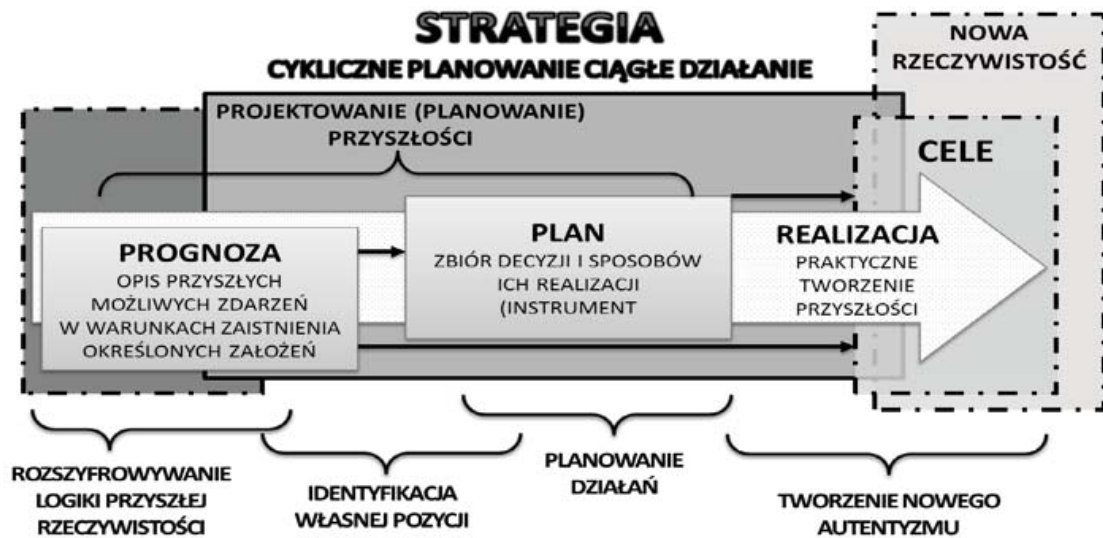
Rys. 1. Strategia jako cykliczne planowanie na tle ciągłego działania.