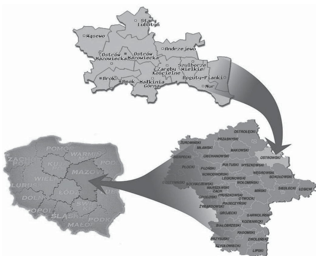
Rysunek 1. Mapa powiatu ostrowskiego wraz z sąsiadującymi powiatami na tle województwa mazowieckiego [www.powiatostrowmaz.pl]

Realizując wytyczne Prezesa KRUS Placówka Terenowa w Ostrowi Mazowieckiej prowadzi działalność na rzecz zapobiegania wypadkom przy pracy w gospodarstwach rolnych. Działalność ta polega na badaniu przyczyn i okoliczności wypadków przy pracy i chorób zawodowych oraz na upowszechnianiu wśród ubezpieczonych wiedzy o zagrożeniach związanych z pracą rolniczą i zasad bezpiecznego wykonywania tej pracy, poprzez prowadzenie nieodpłatnych szkoleń z zakresu bhp oraz różnego rodzaju konkursów [PT KRUS 2012].