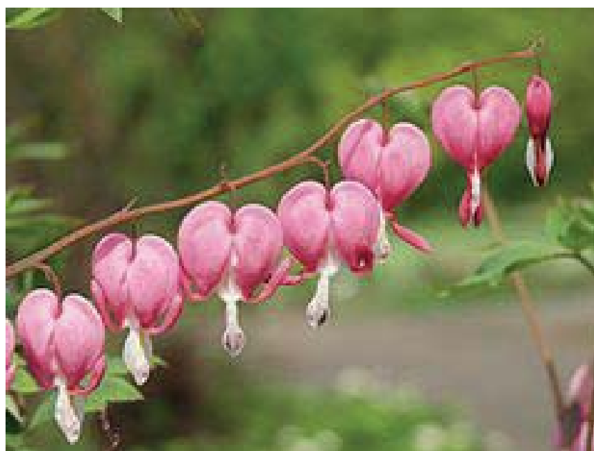
Ryc. 3. Serduszka okazała ( Dicentra spectabilis L.)