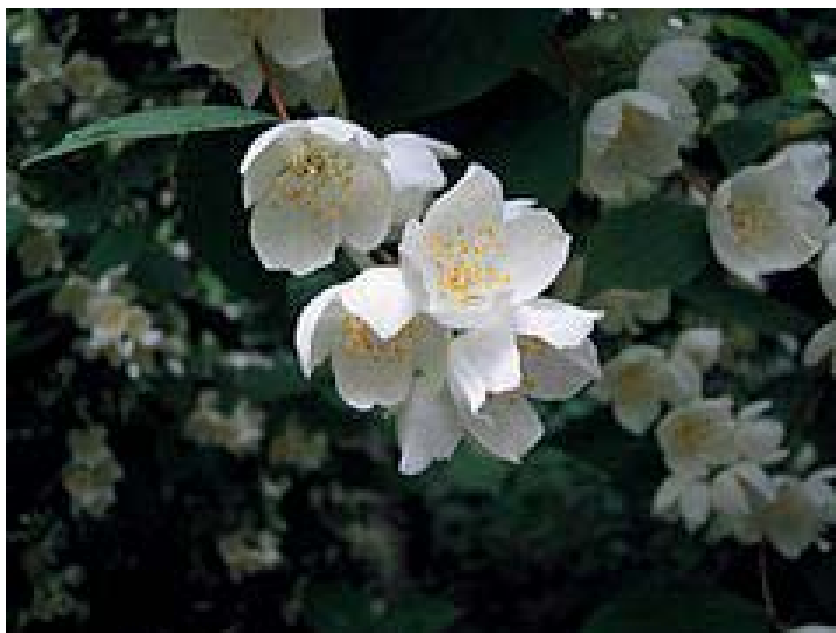
Ryc. 5. Jaśminowiec wonny ( Philadelphus coronarius L.)

Krzewy to rośliny drzewiaste o zdrewniałej łodydze, rozgałęziającej się na wiele pędów. W przeciwieństwie do drzew brak u nich osi głównej - pnia. Krzewy również idealnie komponują się w gospodarstwach agroturystycznych. Do krzewów polecanych do uprawy w gospodarstwach agroturystycznych należy zaliczyć między innymi: jaśminowca wonnego ( Philadelphus coronarius L. – ryc. 5), lilaka pospolitego ( Syringa vulgaris L.), śnieguliczkę białą ( Symphoricarpos albus DuRoi), kalinę koralową ( Viburnum opulus L.), jałowiec pospolity ( Juniperus communis L.), bez czarny ( Sambucus nigra L.), a także forsycję ( Forsythia Vahl).