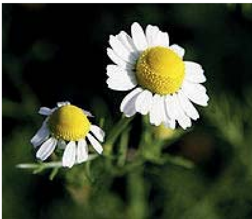
Ryc. 4. Rumianek pospolity ( Matricaria chamomilla L.)

również środki do zwalczania szkodników oraz chorób, są także cennym składnikiem kompostu (Poradnik rolnictwa ekologicznego, 1989). Zioła to rośliny zawierające substancje chemiczne, wpływające na metabolizm u człowieka. Są to gatunki przyprawowe, lecznicze i trujące. Między innymi: bazylika pospolita ( Ocimum basilicum L.), żywokost lekarski ( Symphytum officinale L.), bylica pospolita ( Artemisia vulgaris L.), bylica piołun ( Artemisia absinthium L.), hyzop lekarski ( Hyssopus officinalis ), bylica boże drzewko ( Artemisia abrotanum L.), bylica estragon ( Artemisia dracunculus L.), dziurawiec zwyczajny ( Hypericum perforatum L.), kminek zwyczajny ( Carum carvi L.), koper ogrodowy ( Anethum graveolens L.), cząber ogrodowy ( Satureja fortensis L.), szalwia lekarska ( Salvia officinalis L.), melisa lekarska ( Melissa officinalis L.), lawenda ( Lavandula L.), mięta ( Mentha L.), majeranek ogrodowy ( Origanum Majorana L.), rozmaryn lekarski ( Rosmarinum officinalis ), rumianek pospolity ( Matricaria chamomilla L. – ryc. 4). Ciekawostką jest, że kolendra siewna należy do jednych z najstarszych roślin zielarskich. Była uprawiana już w czasach biblijnych. Ma wiele właściwości leczniczych, między innymi: obniża poziom cholesterolu, poprawia łaknienie. Według Romanowskiej (2010) woń niektórych ziół, takich, jak: rozmarynu lekarskiego, geranium i tymianku pospolitego podnosi ciśnienie krwi.