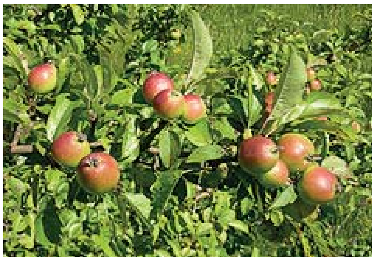
Ryc. 6. Jabłoń domowa ( Malus domestica )