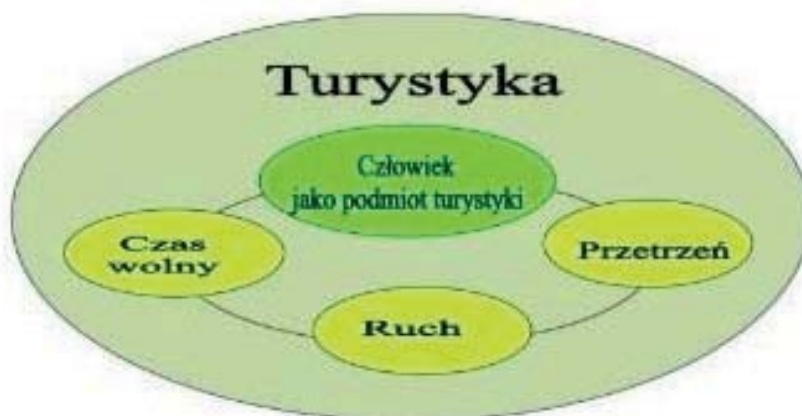
Ryc. 1. Strukturalne ujęcie pojęcia „turystyka”