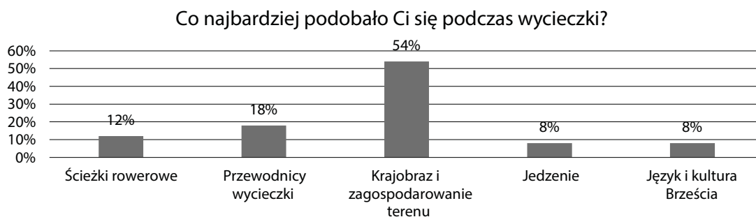
Ryc. 2. Preferencje ankietowanych dotyczące miasta Brześć

Respondentów zapytano również o ich preferencje odnoszące się do Brześcia. Na podstawie badań zamieszczonych na rycinie 2 można stwierdzić, że krajobraz i uwarunkowanie terenu było najczęściej wybieraną odpowiedzią (54%).